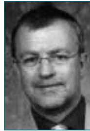
PD Dr. med. Henning Wormstall Psychiatriezentrum Breitenau Breitenaustrasse 124 8200 Schaffhausen

Die Kehrseite der Medaille liegt jedoch im Nebenwirkungsrisiko dieser Massnahmen und erfordert eine äusserst kritische Indikationsstellung. So ist an möglichen Nebenwirkungen zum Beispiel bei den NSAP das erhöhte Ulkusrisiko, bei der Hormonsubstitution ein erhöhtes Krebs- und Thromboserisiko zu nennen. Auch der regelmässige Alkoholkonsum hat seinen Pferdefuss in Form von nicht unerheblichen Folgeerkrankungen. Abschliessend bleibt festzuhalten, dass präventive Massnahmen der Demenz grosse Überschneidungsbereiche mit der Prävention von internistischen Krankheitsbildern (Herz-Kreislauf-Erkrankungen) aufweisen. ■