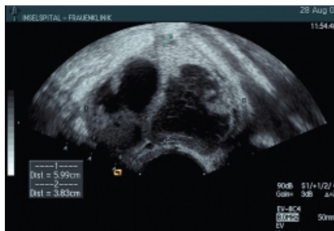
Abbildung 1: Zystische, septierte Raumforderung im Adnexitum beidseitig

Anamnestisch werden unregelmässige Menstruationen bei Menarche vor vier Jahren festgestellt. Es besteht keine Dys-