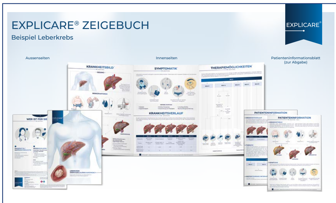
Abbildung 1: Die Zeigebücher enthalten jeweils auch ein Informationsblatt für Patienten. Online sind die Informationsblätter in den neun in der Schweiz am häufigsten gesprochenen Sprachen verfügbar.

tal erhältlich. Die Zeigebücher enthalten zusätzlich ein Informationsblatt zur Abgabe an den Patienten. Dieses ist in der digitalen Version auf der Homepage in den am häufigsten gesprochenen Sprachen der Schweiz erhältlich, das heisst neben Deutsch, Französisch und Italienisch auch auf Englisch, Spanisch, Portugiesisch, Serbisch, Albanisch und Türkisch. Das Angebot ist ausdrücklich Fachpersonen vorbehalten. Als RX-Login-registrierter Nutzer von DOCINSIDE können Sie, wenn Sie eingeloggt sind, ohne neuerliche Anmeldung auch direkt darauf zugreifen. Ohne RX-Login kann auf www.explicare.doctor bei Bedarf ein eigenes Login beantragt werden.