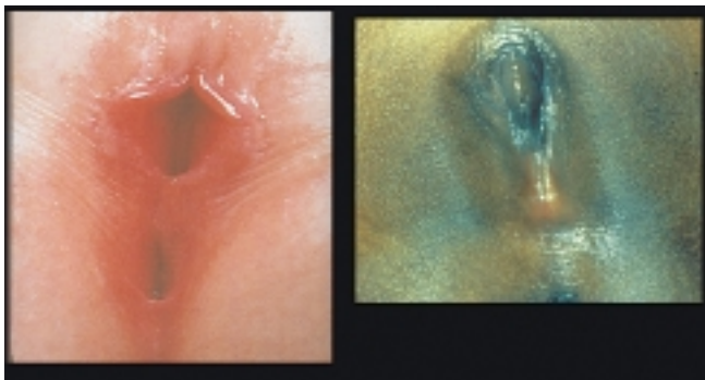
Abbildung 4: Komplette Labiencynechie beim Kind. Die Malformation ist häufig erworben, aber in den seltensten Fällen bleibend.

Abb. unten: Depigmentierter Halo (links unten) und ein pergamentartiges Aussehen mit Hyperkeratose