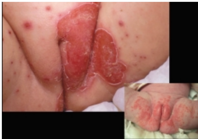
Abbildung 2: Varizellen- und Superinfektion mit Staphylokokken (oben links) in der differenzialdiagnostischen Abgrenzung zu seborrhoischer Dermatitis, vulvarem Ekzem, atopischer Dermatitis und Psoriasis (unten rechts)