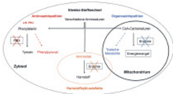
Abbildung 2: Defekte im Abbau von Aminosäuren und in der Entgiftung von Ammoniak:

Die Abbildung zeigt verschiedene Gruppen von enzymatischen Defekten im Stoffwechsel von Aminosäuren und deren Metaboliten sowie in der Entgiftung von Ammoniak. Die Aminoazidopathien betreffen meistens zytosolisch gelegene Enzyme, wie im hier aufgeführten Beispiel der Phenylketonurie (PKU) illustriert wird. Bei den Organoazidopathien können aktivierte CoA-Carbonsäuren, die aus dem Abbau von spezifischen Aminosäuren stammen, aufgrund verschiedener mitochondrialer Enzymdefekte nicht weiter abgebaut werden. Bei den Harnstoffzyklusdefekten liegen verschiedene Defekte vor, welche unter anderem die Entgiftung des Ammoniaks zu Harnstoff erschweren.