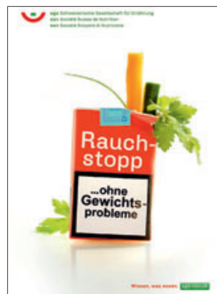
Broschüre im Format A5, vierfarbig, illustriert, 32 Seiten, 2. Auflage 2012.

Kleinere Mengen und Einzel Exemplare können Sie bei SGE, Postfach 8333, 3001 Bern, mit einem an Sie adressierten und frankierten Rückantwortcouvert (Format B5) bestellen. Den Gegenwert der Bestellung legen Sie bitte in Briefmarken bei.