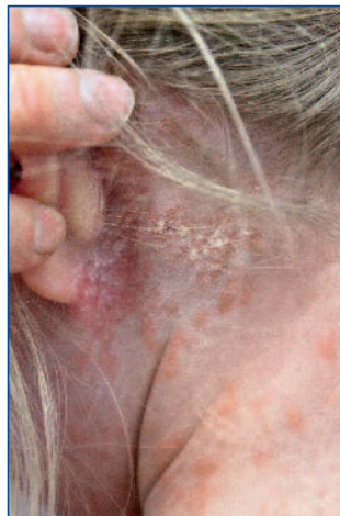
Abbildung 4: Kopfhautbeteiligung bei einem Jungen