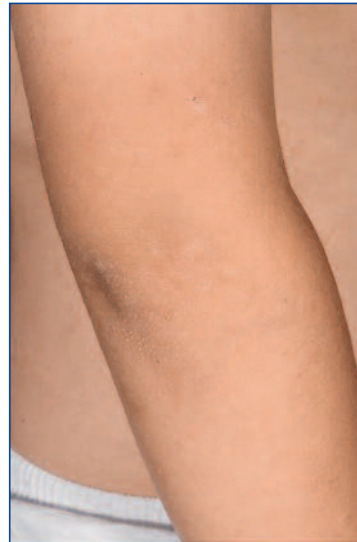
Abbildung 10: Psoriasis bei einem Jungen (erst die Inspektion von Nabel und Rima ani sichern die Diagnose)