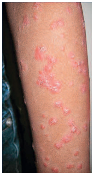
Abbildung 2: Psoriasis guttata nach Streptokokkeninfekt