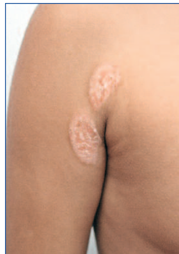
Abbildung 12: Psoriasis inversa bei einem Jugendlichen