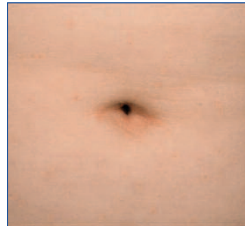
Abbildung 11: Nabelbeteiligung bei einem Jungen mit Psoriasis