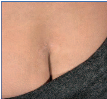
Abbildung 8: Milde psoriatische Beteiligung der Sakralregion bei einem Mädchen