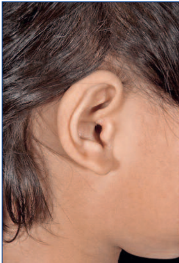
Abbildung 13: Psoriatische Gehörgangsbeteiligung bei einem Mädchen