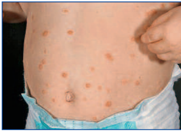
Abbildung 6: Juckreiz bei Psoriasis