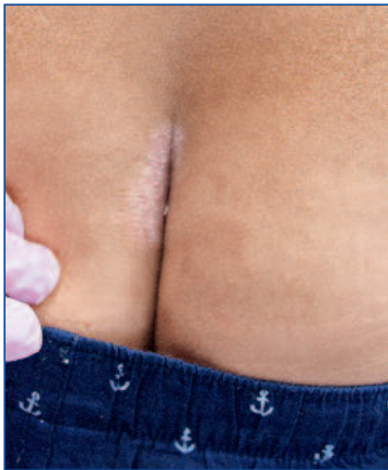
Abbildung 7: Befall der Rima ani bei einem Jugendlichen mit Psoriasis