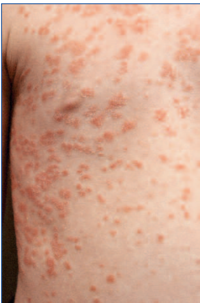
Abbildung 1: Psoriasis guttata nach Streptokokkeninfekt

Ebenfalls von Bedeutung ist im Kleinkindes- und Säuglingsalter die sogenannte Windelpsoriasis (Abbildung 3). Bei 4 Prozent der Patienten dieser Altersgruppe ist nur die Windelregion befallen, bei zirka 13 Prozent die Windelregion neben anderen Körperstellen. Retrospektiv lässt sich aber eine viel häufigere Beteiligung ausmachen, da die Eltern bei einem Viertel der an Psoriasis erkrankten Kinder auch einen Befall der Windelregion zu früheren Zeiten angeben (8). Vermutlich spielt der isomorphe Reizeffekt eine Rolle,