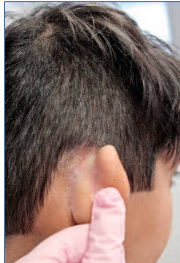
Abbildung 14: Retroaurikuläre Psoriasis bei einem Jugendlichen

12 Jahren zugelassen. Es darf aufgrund der Gefahr einer Hyperkalzämie bei Resorption nach grossflächiger Applikation auf maximal 30 Prozent der Körperoberfläche aufgetragen werden. Da es ausserdem irritativ wirken kann, ist es für die Anwendung im Gesicht oder intertriginös oft ungeeignet.