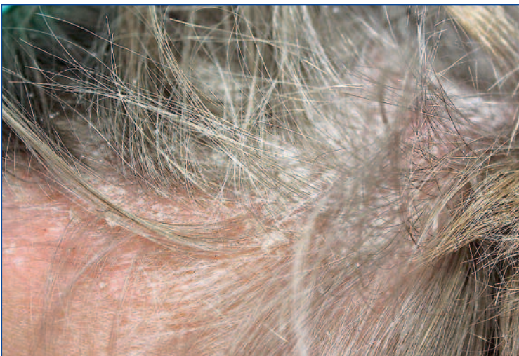
Abbildung 5: Kopfhautpsoriasis bei einem Mädchen mit Psoriasis guttata

also eine Triggerung durch mechanische Reizung der Windel und durch Stuhl und Urin. Im Gegensatz zur Candida-getriggerten Windeldermatitis fehlen Satellitenherde. Eine Rarität stellt die lineare Blaschko-Psoriasis dar.