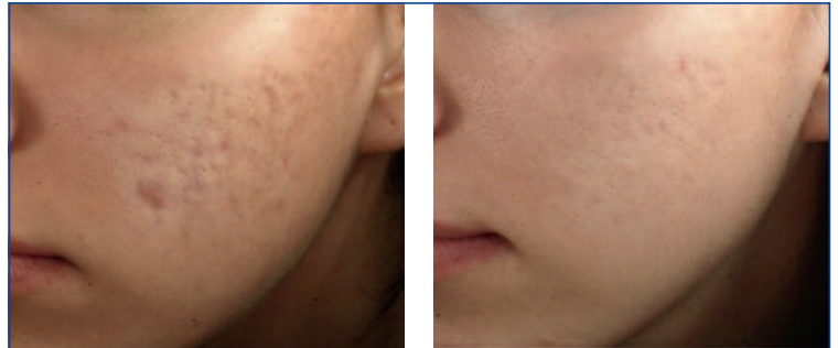
Abbildung 3: Vor der Behandlung und nach drei nicht ablativen fraktionierten Laserbehandlungen