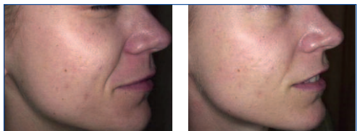
Abbildung 5: Hautstraffung durch Behandlung mit fraktioniertem CO 2 -Laser

Dadurch kann die Inkubationszeit verringert werden, und die übliche Kürettage aktinischer Keratosen ist in der Vorbereitung nicht mehr erforderlich (13). Aber auch für andere Wirkstoffe wird dieses Verfahren verwendet: Es gibt Konzepte mit Vitamin-A-Säure, Vitamin C, Hyaluronsäure, Resveratrol und so weiter. Auch PRP kann statt per Injektion (Meso-therapie) über die fraktionierte Lasertherapie in die Haut eingebracht werden.