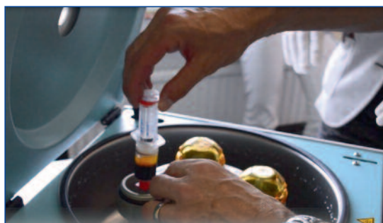
Abbildung 6: PRP-Gewinnung durch Zentrifugieren

Aufgrund der positiven Literaturberichte haben auch wir begonnen, unsere Patienten nach Laserbehandlungen supportiv mit PRP zu behandeln. Mittels der ACP®-Doppelspritze (Firma Arthrex) wird das PRP aufbereitet. Bei diesem auch unter dem Namen Personalized Cell Therapy bekannten PRP-Verfahren werden 15 ml Blut über ein Butterfly direkt in die Doppelspritze aufgezogen. Die Spritze wird bei 350 G für 5 Minuten horizontal zentrifugiert. Nach der Zentrifugation wird zuerst das plättchenreiche Plasma (ca. 5 ml im oberen Drittel der Spritze) in den inneren Kolben der Doppelspritze aufgezogen. Nach dem Herausdrehen der inneren Spritze steht das PRP zur Applikation bereit. Da auf die Zugabe von Antikoag-