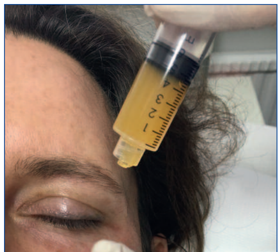
Abbildung 1: 5 ml PRP