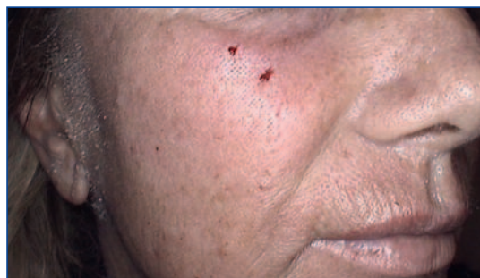
Abbildung 4: Direkt nach ablativer fraktionierter Laserbehandlung