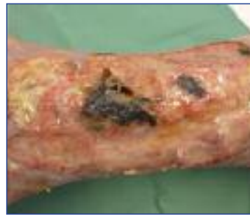
Abbildung 2: Ulcus hypertonicum Martorell mit ausgedehnten nekrotischen Wundarealen