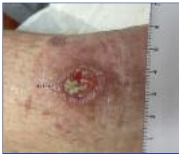
Abbildung 1: Teils granulierendes, teils fibrinbelegtes Ulcus cruris, bei dem das mechanische oder scharfe Débridement ein wichtiger Teil der Therapie ist