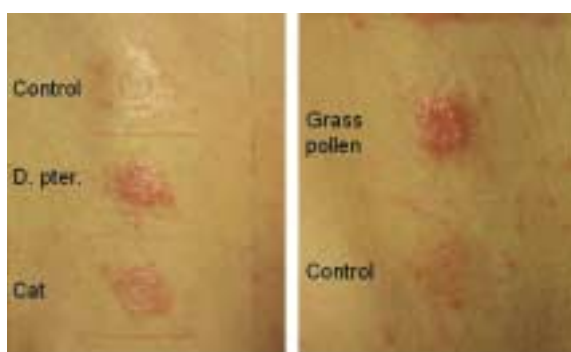
Abbildung 2: Positiver Atopie-Patchtest mit Hausstaubmilben, Katzenepithelien und Graspollen.

tests verwendet werden. Die hochmolekularen Allergene werden in einer Sonderform des Epikutantests am Rücken appliziert (Ablesung nach 24 und 48 Stunden). Ein positiver Patchtest entspricht – im Gegensatz zur urtikariellen Quaddel beim Pricktest – dem Krankheitsbild des Ekzems. Eine Studie gibt den positiven prädiktiven Wert (PPV) eines positiven Atopie-Patchtests mit 95 Prozent für Kuhmilch, 94 Prozent für Hühnerei und sogar 100 Prozent für Weizen an. Andere Autoren fanden auch niedrigere PPV für Nahrungsmittelallergene, sodass zum Teil trotzdem orale Provokationstests erforderlich waren. Für die wichtigsten Inhalationsallergene stehen kommerzielle Testextrakte zur Verfügung. Ein positiver Patchtest mit Hausstaubmilben oder Pollen ist bei Lokalisation der Neurodermitis im Gesicht (Augenlider) und Halsbereich von klinischer Bedeutung (Abbildung 2). Bei einigen Studien ergaben sich positive Atopie-Patchtests auch bei nicht-IgE-assoziiertem atopischer Dermatitis (Abbildung 3).