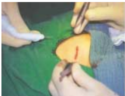
Abbildung 2: Klebetechnik: Der Kleber darf nicht in die Wunde gelangen.

Eine kritische Anmerkung zur Wunddesinfektion: Verzichteten Sie auch nach der Lokalen auf das ausgiebige Bad der Wunde in Betaisodona®! Desinfektionsmittel hemmen die