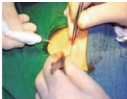
Abbildung 3: Zuerst werden die Wundränder adaptiert.