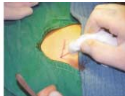
Abbildung 4: Dann erst wird der Kleber aufgetragen.