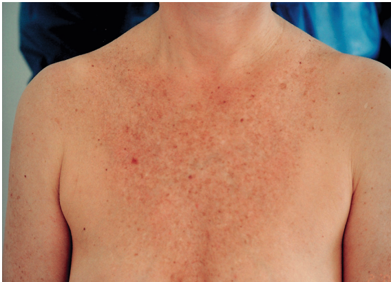
Abbildung 2b: Décolleté nach der ersten Peelingbehandlung: Deutliche Aufhellung und Minimierung der Präkanzerosen und Lentiginen solares.

Brennens der Haut und die Rötung bestimmen den Zeitpunkt der Neutralisation der Säure. Diese erfolgt durch Auftragen einer als Lauge wirkenden Natriumbicarbonatlösung. Danach wird die Haut mit Eiswasser gekühlt beziehungsweise abgewaschen. Es folgt eine Nachbehandlung mit rückfettenden, heilungsfördernden Kühlsalben. Dauer und genaue Zahl der oberflächlichen Peelingbehandlungen sind immer sehr individuell und müssen von Patient zu Patient bestimmt werden. Um ein erfolgreiches Resultat zu erzielen, können oberflächliche Peelings mehrere Male angewendet werden.