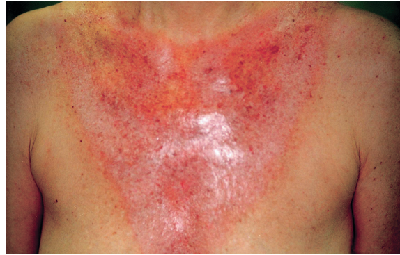
Abbildung 1a: Trichloressigsäure-Behandlung eines sonnengeschädigten Décolletés mit unterschiedlichen Pigmentierungen und aktinischen Fältchen. Nach Applikation einer oberflächlichen Peelinglösung (15-prozentige TCA) stellt sich der «Frost» ein.

Nach einem vierwöchigen Cremeprogramm zur Vorbereitung der Haut wird Glykolsäure gleichmässig mit einem Pinsel beginnend an der Kinnregion im Uhrzeigersinn auf die Gesichtshaut aufgetragen. Das Einsetzen des