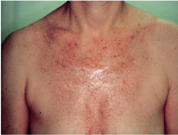
Abbildung 2a: Décolleté mit sonnengeschädigter Haut vor der Peelingbehandlung: Aktinische Keratosen, Lentiginen solares und flache seborrhoische Keratosen