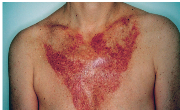
Abbildung 1b: Drei Tage nach einem «Weekend Peeling» sieht das Décolleté recht mitgenommen aus. Die gepeelte Haut färbt sich kastanienrot und beginnt sich zu schälen.