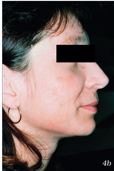
Abbildung 4: Behandlung der Akne mit sichtbaren Akneeffloreszenzen und Närbchen.

4a vor einem TCA-Peeling (30%) 4b Resultat nach zweimaligem TCA-Peeling (30%): Abflachung der Narben, feinere Poren und Rückbildung der Akne.