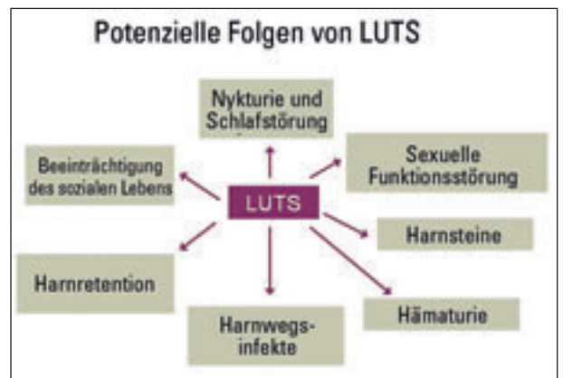
Abbildung 2: Potenzielle Folgen von LUTS

zusammen: «Wirksamkeit und Nebenwirkungen sind bei pflanzlichen Präparaten recht nah bei Placebo», sagte er. Das bedeute aber nicht, dass Phytotherapeutika schlecht seien. «Phytotherapeutika helfen vielen Männern», sagte er. «Vergessen wir nicht, dass der Placeboeffekt bei BPH kein geringer ist!» 30 bis 40 Prozent der Wirkung liessen sich auf Placeboeffekte zurückführen. Einzelne Phytotherapiestudien sprächen auch für eine etwas grössere Ausbeute.