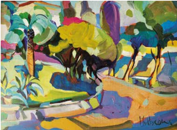
Claudio Malacarne Giardino a Sirmione (Lago di Garda), Öl auf Leinwand, 30 × 40 cm