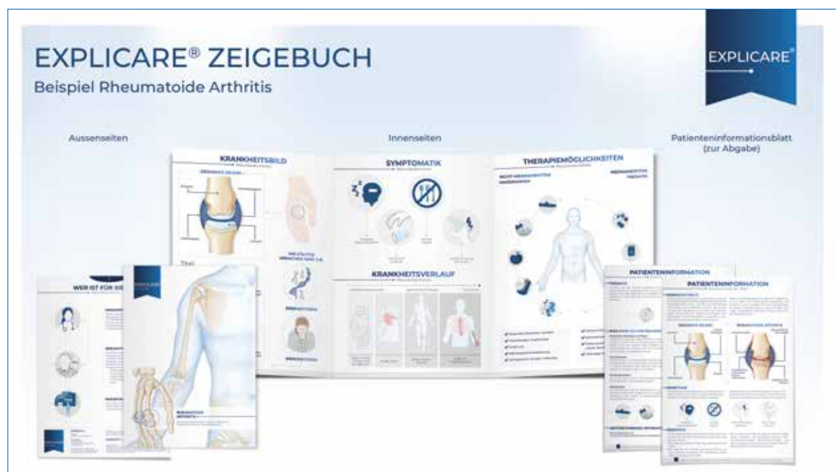
Abbildung 1: Die Zeigebücher enthalten jeweils auch ein Informationsblatt für Patienten. Online sind die Informationsblätter in den neun in der Schweiz am häufigsten gesprochenen Sprachen verfügbar.

Aktuell liegen Zeigebücher zu 29 Krankheitsbildern vor, von Acne Inversa bis zum Vorhofflimmern; weitere Indikationen sind in Bearbeitung. Die Fachbereiche reichen von der Dermatologie, Pneumologie, Kardiologie, Onkologie, Gastroenterologie, Neurologie, Ophthalmologie, Immunologie, Diabetologie, Allgemeine innere Medizin, Rheumatologie bis zur Psychiatrie. Zusätzlich gibt es Zeigebücher zu speziellen