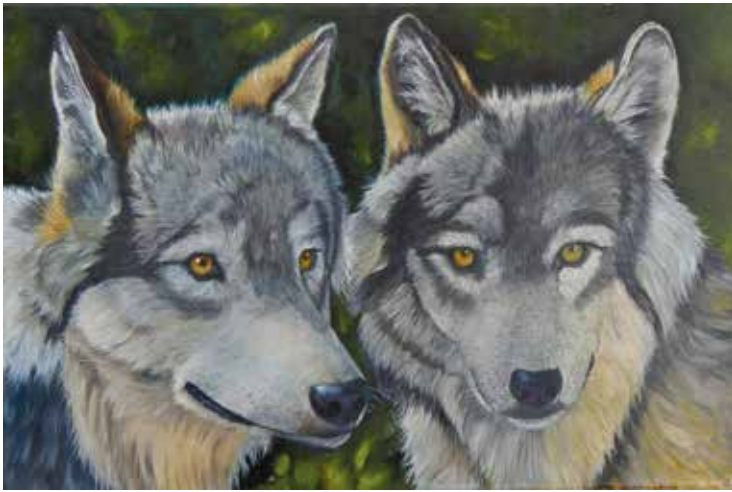
Gary Wakeham Brothers, Öl auf Leinwand, 60 × 39 cm