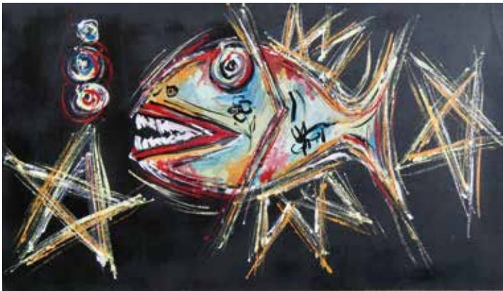
Omaggio a Basquiat

Freddie Oort, Mixed Media (Acryl und Spray), 40 × 70 cm