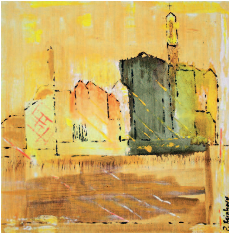
Villages perchés de Provence

Peter Reinhard: Acryl auf Leinwand, 30 × 30 cm