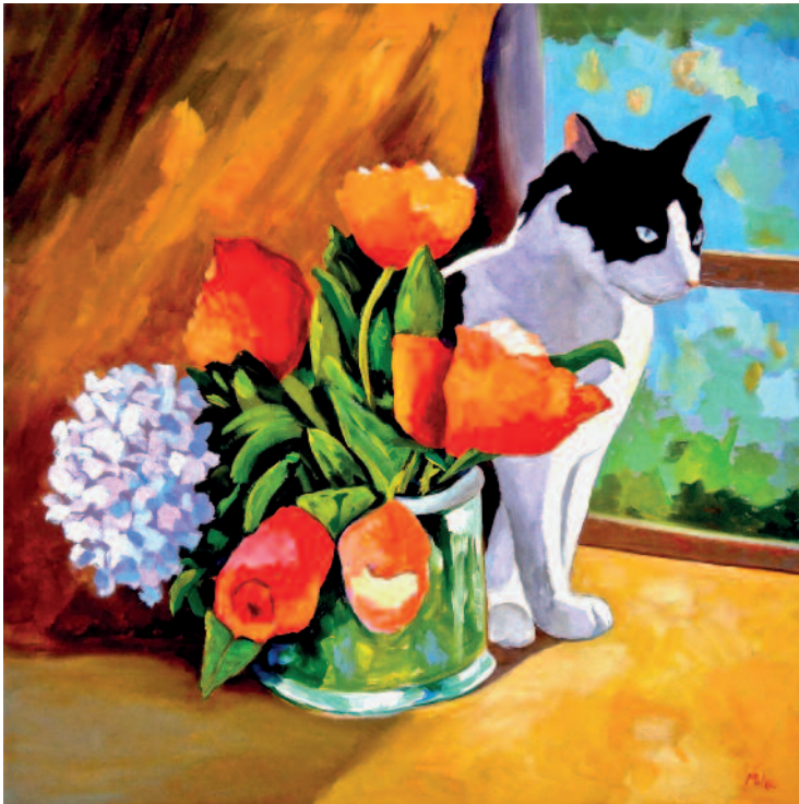
Gatto alla finestra