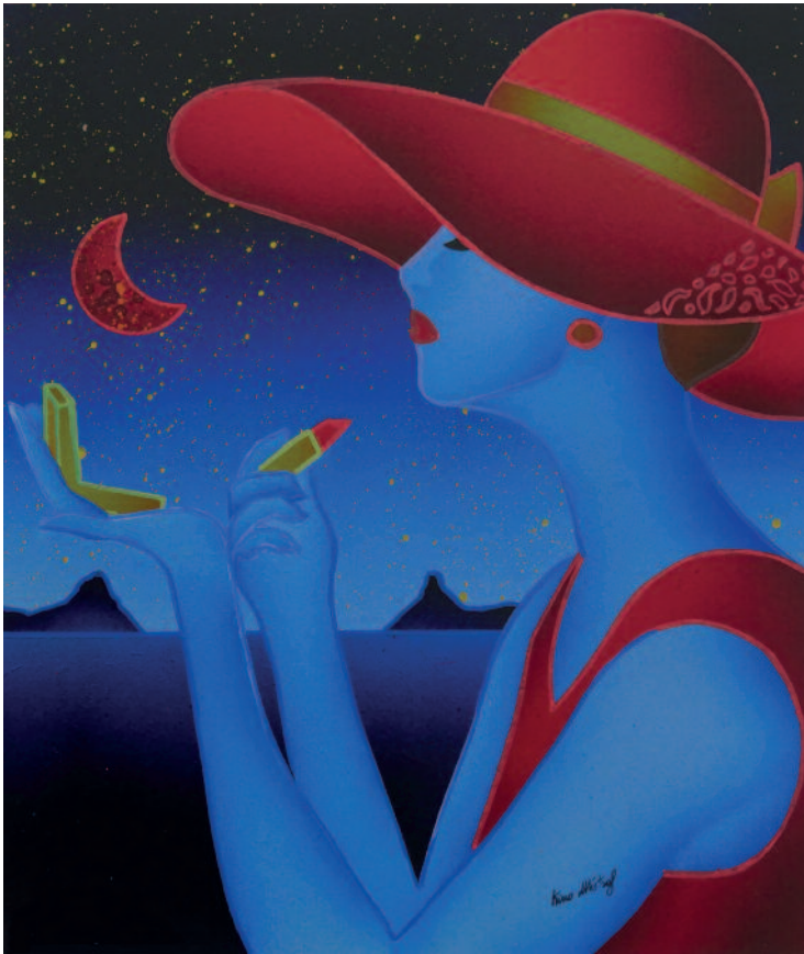
Notte sul mare