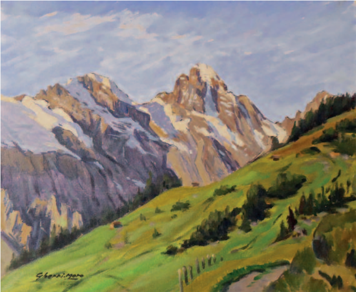
Tschingelhorn Bruno Gherrri-Moro, Öl auf Leinwand (45 × 37 cm, mit Rahmen 59 × 50 cm) Nähreres zum Bild auf Seite 258.