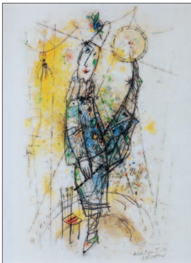
Herbert Leupin – Mischtechnik, 40 × 54 cm