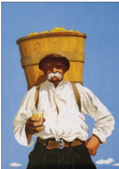
Herbert Leupin – Plakat, 1941