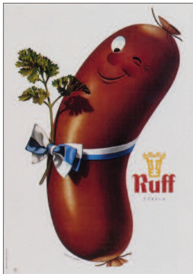
Herbert Leupin – Plakat, 1946