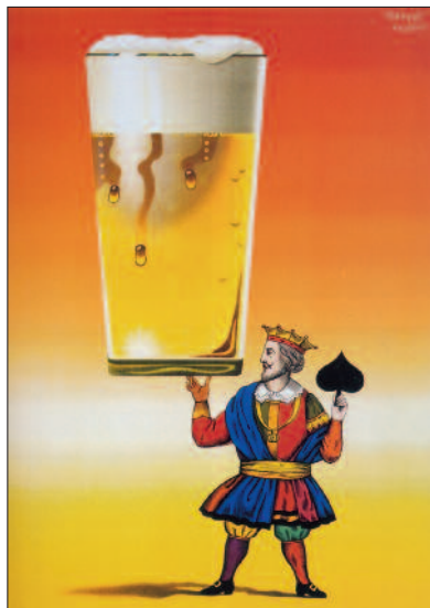
Herbert Leupin – Plakat, 1953