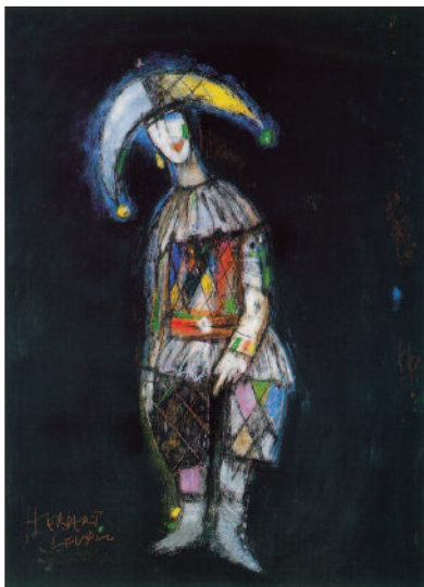
Herbert Leupin – Mischtechnik, zirka 75 x 90 cm