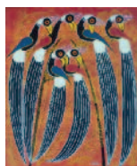
ARS MEDICI 3/16: Paradiesvögel (verkauft!)