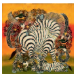
ARS MEDICI 1/16: Zebra (verkauft!)