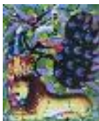
ARS MEDICI 20/15: Löwe und Pfau (verkauft!)