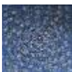
ARS MEDICI 22/15: Fischwirbel (verkauft!)