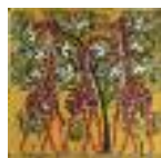
ARS MEDICI 23/15: Giraffen und Vögel (verkauft!)