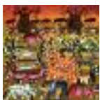
ARS MEDICI 21/15: Tiere, Abendrot (verkauft!)