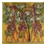
ARS MEDICI 23/15: Giraffen und Vögel (verkauft!)