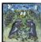
ARS MEDICI 24/15: Affen und Vögel (verkauft!)