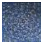
ARS MEDICI 22/15: Fischwirbel (verkauft!)