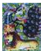
ARS MEDICI 20/15: Löwe und Pfau (verkauft!)