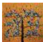
ARS MEDICI 19/15: Perlhühner auf Orange (verkauft!)