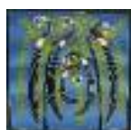
ARS MEDICI 18/15: Paradiesvögel auf Hellblau (verkauft!)