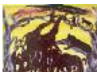
ARS MEDICI 14+15/15: Tiere auf Braun (verkauft!)