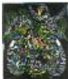
ARS MEDICI 10/15: Vögel auf schwarz (verkauft!)