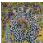
ARS MEDICI 12/15: Geparden (verkauft!)