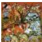
ARS MEDICI 11/15: Tiere (verkauft!)