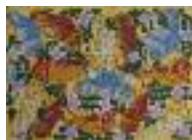
ARS MEDICI 13/15: Chamäleons