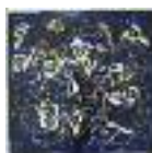
ARS MEDICI 16/15: Vögel auf Blau