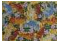
ARS MEDICI 13/15: Chamäleons