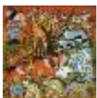
ARS MEDICI 11/15: Tiere