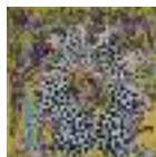
ARS MEDICI 12/15: Geparden