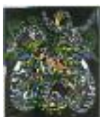
ARS MEDICI 10/15: Vögel auf schwarz