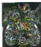
ARS MEDICI 10/15: Vögel auf schwarz (verkauft!)