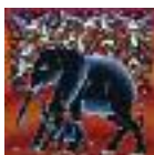
ARS MEDICI 8/15: Elefant mit Jungem (verkauft!)