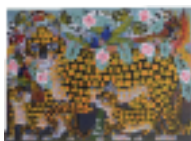
ARS MEDICI 7/15: Leoparden, Vögel (verkauft!)