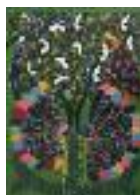
ARS MEDICI 9/15: Vögel auf grün (verkauft!)