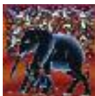
ARS MEDICI 8/15: Elefant mit Jungem (verkauft!)