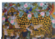
ARS MEDICI 7/15: Leoparden, Vögel (verkauft!)