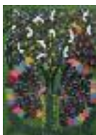
ARS MEDICI 9/15: Vögel auf Grün (verkauft!)