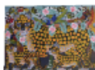
ARS MEDICI 7/15: Leoparden, Vögel (verkauft!)