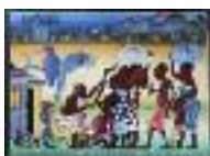
ARS MEDICI 4/15: Buschpraxis (verkauft!)