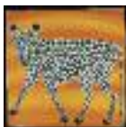
ARS MEDICI 3/15: Leopard auf orange (verkauft!)