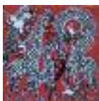
ARS MEDICI 2/15: Giraffen rot (verkauft!)