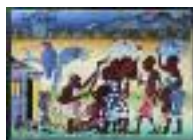
ARS MEDICI 4/15: Buschpraxis