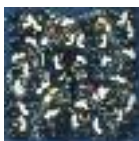
ARS MEDICI 1/15: Paradiesvögel blau (verkauft!)