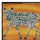
ARS MEDICI 3/15: Leopard auf orange (verkauft!)