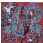
ARS MEDICI 2/15: Giraffen rot (verkauft!)