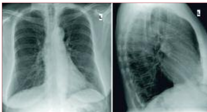
Abbildung 2: Röntgenthorax p.a. und lateraler Strahlengang: Abflachung der Zwerchfellkuppen, vermehrte Strahlentransparenz retrosternal und retrokardial sowie Vergrößerung der Interkostalräume als Hinweis auf eine Lungenüberblähung

Derzeit ist ein solches Molekül für die Routinediagnostik der COPD noch nicht identifiziert (22). Adiponectin könnte ein solcher Biomarker sein. Hohe Plasma-Adiponectin-Spiegel sind in der COPD-Gen-Studie unabhängige Prädiktoren für das Vorliegen eines unterlappenbetonten Emphysems in der CT-Diagnostik sowie für einen schnelleren Lungenfunktionsverlust (23).