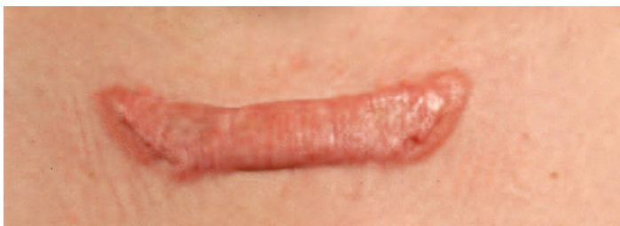
Abbildung 2: Keloid. Das überschüssige Narbengewebe wächst wulstartig oder lippenförmig über die Grenzen der ursprünglichen Wunde hinaus