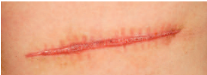
Abbildung 1: Hypertrophe Narbe. Überschiessende, auf die ursprüngliche Wundregion begrenzte Bildung von Narbengewebe