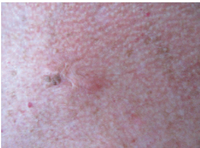
Abbildung 4: Keloid neben seborrhoischer Keratose