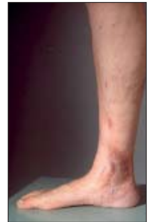
Abbildung 2: Nach Cross-ektomie und Stripping der V. saphena magna komplette Heilung innerhalb von 8 Wochen. Seit 16 Jahren kein Rezidiv mehr aufgetreten.

oder instabilen Narbe (ca. 0,2% aller Unterschenkelulzerationen). Bei der letzteren Form spricht man auch vom Marjolin-Ulkus, wobei dieser Begriff streng genommen auf maligne entartete Verbrennungswunden zutrifft. Aber auch andere chronisch-entzündliche oder chronisch-fistulierende Prozesse – wie chronische venöse Ulzera, eine chronische Osteomyelitis oder eine chronische Hauttuberkulose ( Lupus vulgaris ) – können selten sekundär maligne entarten und in ein meistens histologisch wenig differenziertes und biologisch aggressives spinozelluläres Karzinom der Haut übergehen.