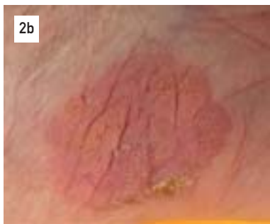
2b: Persistenz nach 3 x PDT und 4 Wochen Imiquimod 3x/Woche