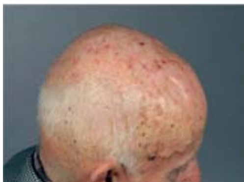
Abbildung 1: Aktinische Keratosen/M. Bowen auf sonnenexponierter Haut

Therapeuten abhängt, variieren die Abheilraten von 75 bis 98 Prozent. Die Rezidivrate innerhalb des ersten Jahres Nachbeobachtung wird mit 1,2 bis 12 Prozent angegeben.