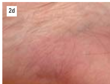
2d: 9 Monate nach Therapie: Vollständige Abheilung

sind die zum Teil kosmetisch unbefriedigenden Resultate. Liegen bei Patienten Probleme in Bezug auf die Compliance vor, sind die Kryotherapie und die fotodynamische Therapie von Vorteil. Wird zur Behandlung aktinischer Keratosen die fotodynamische Therapie gewählt, müssen häufig auftretende Schmerzen berücksichtigt werden. Stehen die Nebenwirkungen im Vordergrund, ist die Anwendung von Diclofenac am besten geeignet. Auch können aufgrund der geringen Nebenwirkungen die Kryotherapie und der Einsatz von Imiquimod in Erwägung gezogen werden.