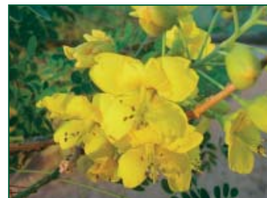
Abbildung 2: Cassia senna

Darunter versteht man Salze wie Natriumsulfat (Glaubersalz), Magnesiumsulfat (Bittersalz), Zucker beziehungsweise Zuckeralkohole wie Laktulose oder Laktikol sowie Polyethylenglykole (PEG) wie Macrogel. Sie werden alle im Darm kaum resorbiert. Das führt zu einer Sekretion von Wasser, was den Darminhalt weicher macht und so die Transportgeschwindigkeit erhöht. Die zuckerhaltigen Laxanzien werden im Darm durch Bakterien schnell gespalten, wodurch Fettsäuren entstehen, die selber eine antilaxative Wirkung aufweisen. Die laxative Wirkung dieser zuckerhaltigen Laxanzien tritt dann ein, wenn sie in so grossen Mengen in den Darm gelangen, dass die Zucker spaltenden Darmbakterien nicht die gesamte Menge verarbeiten können. PEG haben zwar eine geringere Wirksamkeit als die zuckerhaltigen Laxanzien, dafür werden sie von der Darmflora nicht abgebaut.