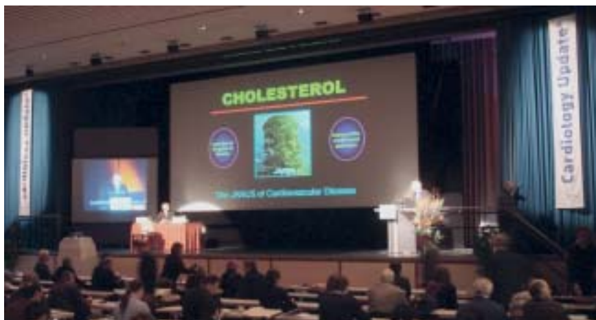
Abbildung: Mit über 800 Teilnehmerinnen und -teilnehmern aus 45 Ländern und einem wissenschaftlichen Komitee von über 90 weltweit führenden Spezialisten war das 18. Cardiology Update in Davos einer der führenden europäischen Herzkongresse.