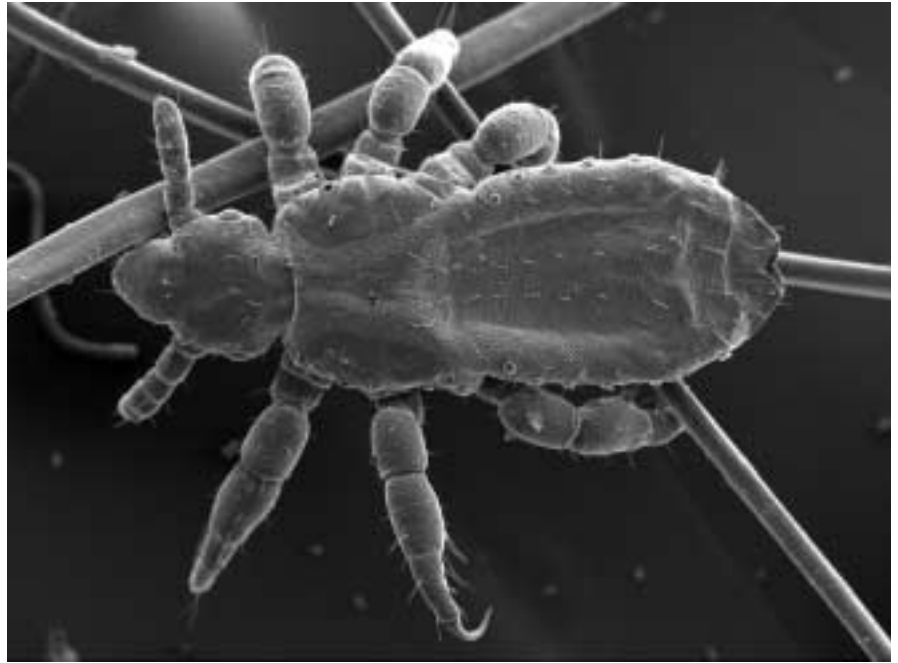
Kopflauslarve zwischen Menschenhaaren.

In Entwicklungsländern, wo keine geeigneten Substanzen zur Verfügung stehen oder diese für die Bevölkerung unerschwinglich sind, bevorzugen die Betroffenen traditionelle Behandlungen, die zumeist wenig erfolgreich sind. Auch Agrarpestizide