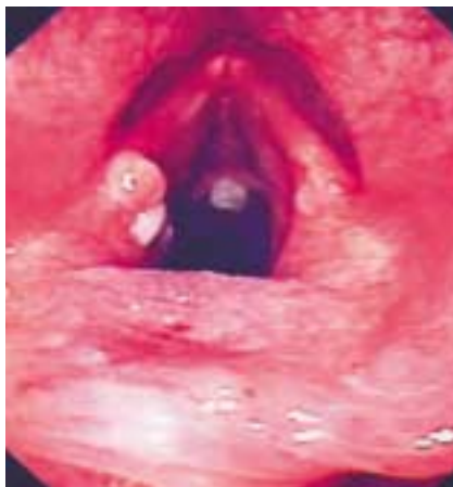
Abbildung 2: Refluxbedingte Pachydermie des posterioren Aspektes der Stimmbänder

der Reflux ein bedeutender aggravierender Faktor sein, dessen adäquate Behandlung mit PPI wesentlich zur Stabilisierung des Asthmas beiträgt.