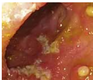
Abbildung 5: NSAR-induzierte Entzündung mit fibrinbedeckten Ulzerationen