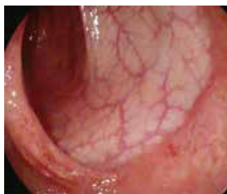
Abbildung 2: Typische Befunde einer Linksseitenkolitis (links) und eines Morbus Crohn in der Endoskopie (rechts)