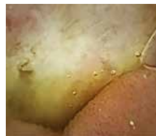
Abbildung 3: Morbus Crohn des Dünndarms (Kapselendoskopie)