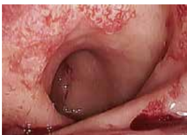
Abbildung 7: Radiogene Kolitis mit typischen Angiodysplasien