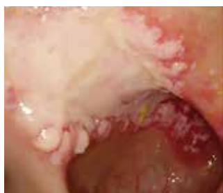
Abbildung 8: Ulzeration bei Mukosaprolaps