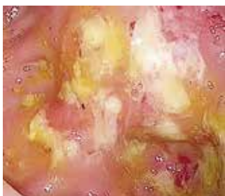
Abbildung 1: Chronische Kolitis, bedingt durch Amöben