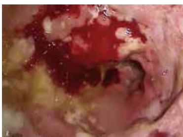
Abbildung 9: Schwere chlamydien-induzierte Proktitis

sie ab, heilen die Läsionen meist nach etwa 3 Wochen. Narbige Stenosierungen sind längerfristig möglich. Meist lösen NSAR-haltige Suppositorien mukosale Läsionen und Ulzerationen oder Strikturen in der anorektalen Region aus und sind eine Differenzialdiagnose zur Proctitis ulcerosa (16, 17). Bei der antibiotikaassoziierten Diarrhö (AAD)/Kolitis gibt es Subtypen: Die häufige einfache Form mit weichem, voluminösem Stuhl (typisch z.B. unter Ampicillin) ist Folge einer veränderten Mikrobiota. Die Durchfälle hören meist nach Absetzen des Antibiotikums auf. Prophylaktisch kann man die Antibiose zum Beispiel mit einem Hefepreparat ( Saccharomyces boulardii ) kombinieren.