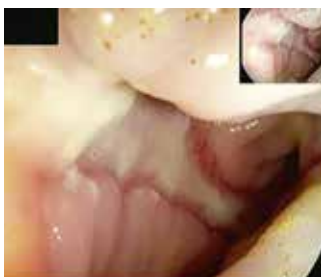
Abbildung 4: Ischämische Kolitis mit typischen Ulzerationen