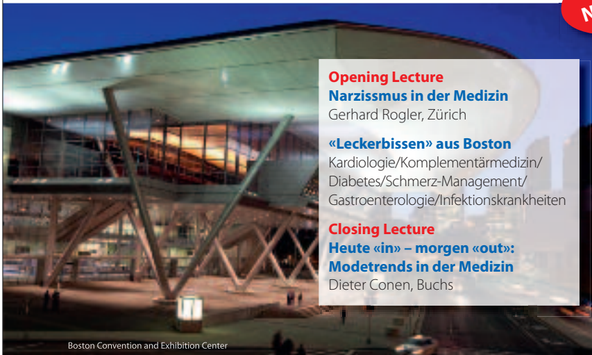
Boston Convention and Exhibition Center