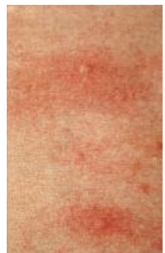
Abbildung 2 und 3: Urtikaria (links), Anstrengungsurtikaria (rechts).