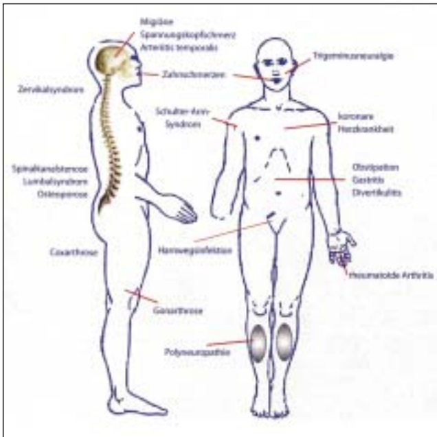
Abbildung 1: Ätiologie tumorunabhängiger und therapiebedingter Schmerzen