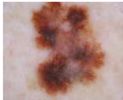
Superfiziell spreitendes Melanom, Auflichtmikroskopie (Dermatoskopie)

mit einer Tumordicke bis zu 1 mm liegt die Zehnjahres-Überlebensrate bei über 90 Prozent. Beim High-Risk-Melanom mit einer Tumordicke von über 4 mm sind nach zehn Jahren weniger als die Hälfte der Patienten noch am Leben. Bei lokoregionären Lymphknotenmetastasen beträgt die Zehnjahres Überlebensrate zirka 30 Prozent, bei Fernmetastasen weniger als 5 Prozent.