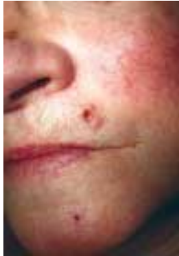
Noduläres Basalzellkarzinom oberhalb der Oberlippe