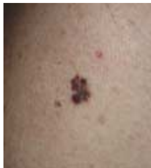
Superfiziell spreitendes Melanom am Oberarm