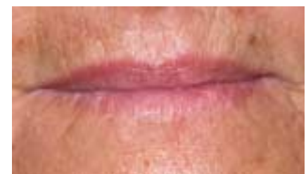
Initiales Plattenzellkarzinom nach laserassistierter Operation

Die Prognose des malignen Melanoms hängt entscheidend von der Eindringtiefe in die Haut ab. Beim Low-Risk-Melanom