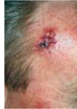
Fibrosierendes Basalzellkarzinom temporal