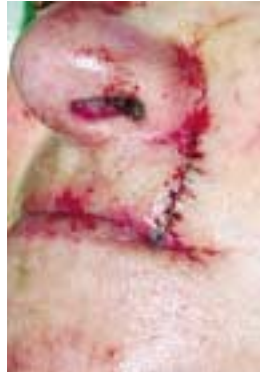
Basalzellkarzinom oberhalb der Oberlippe, intraoperativ