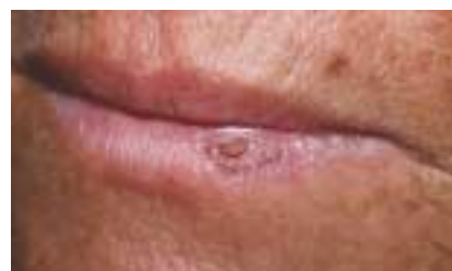
Initiales Plattenzellkarzinom an der Unterlippe

In der Schweiz erkranken pro Jahr zirka 1200 Menschen am kutanen malignen Melanom. Die Tendenz ist steigend. Die Inzidenzraten liegen in den Alpenländern Schweiz und Österreich deutlich höher als in den übrigen europäischen Ländern, was man auf die speziellen Freizeitaktivitäten in der Berglandschaft zurückführt. Das maligne Melanom geht von den pigmentbildenden Zellen (Melanozyten oder Nävuszellen) der Haut, seltener der Schleimhaut, der Aderhaut des Auges oder den Hirnhäuten aus. Maligne Melanome entwickeln sich spontan auf normaler Haut oder auf dem Boden eines Pigmentnävus, ausgehend vom Stratum basale der Epidermis. Zur klinischen Beurteilung und Differenzialdiagnose ist die so genannte ABCDE-Regel hilfreich, die folgende Aspekte betrachtet: Asymmetrie, Begrenzung, Colorit (Farbe), Durchmesser (kleiner oder grösser als 5 mm) und Entwicklung.