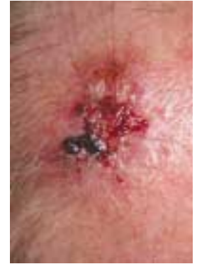
Fibrosierendes Basalzellkarzinom: Detail

Areale und werden oft lange Zeit als Ekzem verkannt. Zur korrekten Diagnosestellung eines Basalioms wird in der Regel eine kleine Biopsie benötigt. Nach Vorliegen der histologischen Begutachtung wird das therapeutische Vorgehen in Abhängigkeit von Tumortyp, Lokalisation und Alter des Patienten festgelegt.